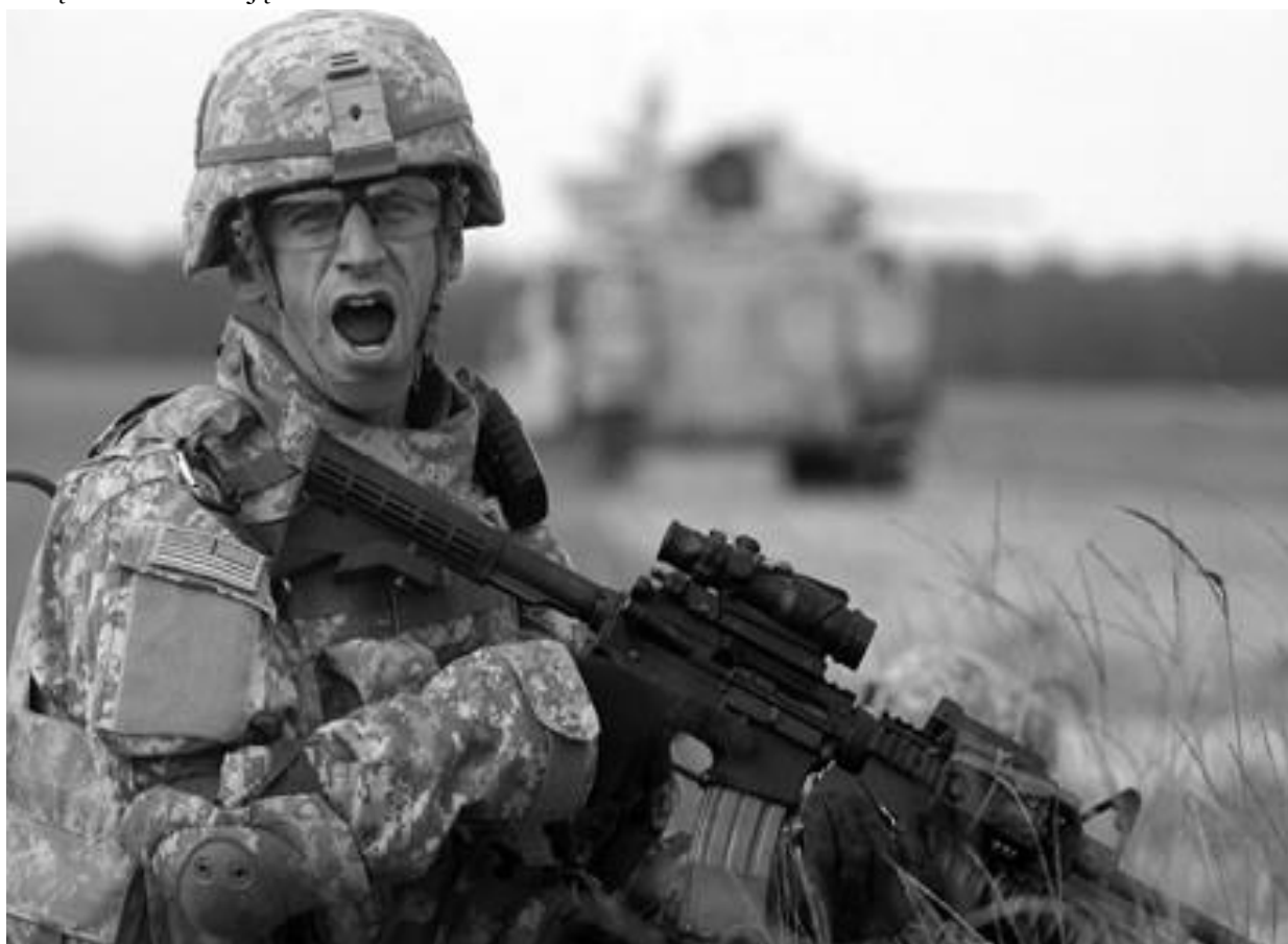
Załącznik nr 1: zdjęcia